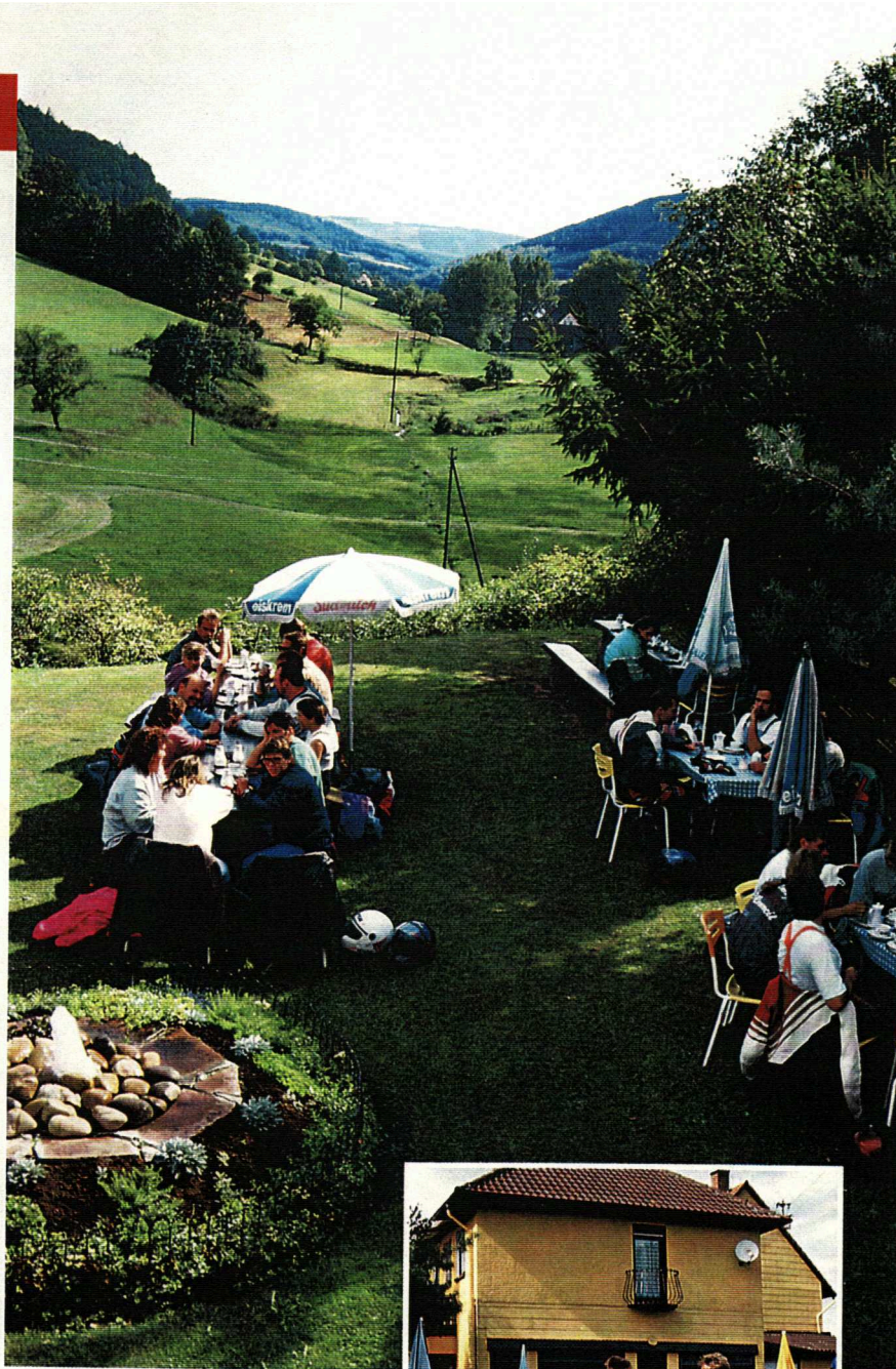
Kühle Drinks in lieblicher Landschaft: Beim Plausch unterm Sonnenschirm (rechts) haben die Gäste von der Sommerterrasse einen herrlichen Blick über das gesamte Sensbachtal (oben).