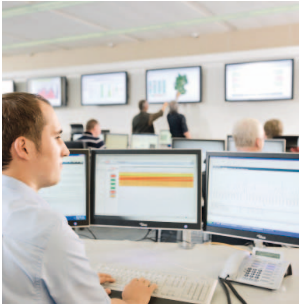
Zum ersten Mal gibt es einen zentralen Zugriff auf die Datenverarbeitung bei allen Dienststellen

STICHWORT: KOSTEN. So weiß noch niemand, wie hoch sie für zusätzliche Leistungen neben dem vertraglich